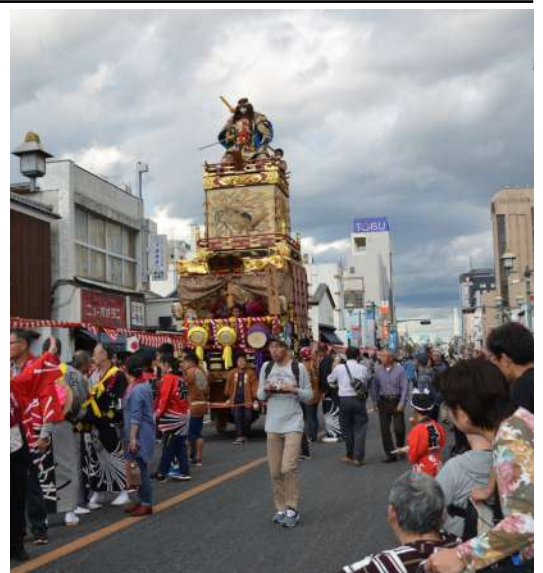
とちぎ秋祭り。絢爛豪華な人形山車に息を呑む