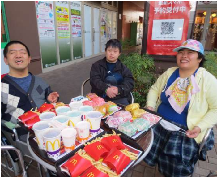
たくさんのハンバーガーに笑顔満開!!

今日の土曜開所日は、“みんなで外出を楽しもう”という日です。行き先と何を食べたいかグループごとにわかれて相談し、行き先が決まったグループから車両4台に分かれて、職員さんや大学生のボランティアさんと一緒にそれぞれ出発しました。行き先は、那須塩原市にある千本松牧場へ足をのばし、牛やうさぎなどとふれあい、動物たちと癒しの時間を過ごしたグループ。 小山市にあるショッピングモールを訪れたグループは、本屋さんでイケメンアイドルが載っている雑誌、ミニカー、歴史の本、100円ショップでカゴなどを選び、買い物を楽しみました。昼食はマクドナルドでハンバーガー、ポテト、ジュースを頼みました。メンバーはみんなで11人なので、それはそれはたくさんのハンバーガー