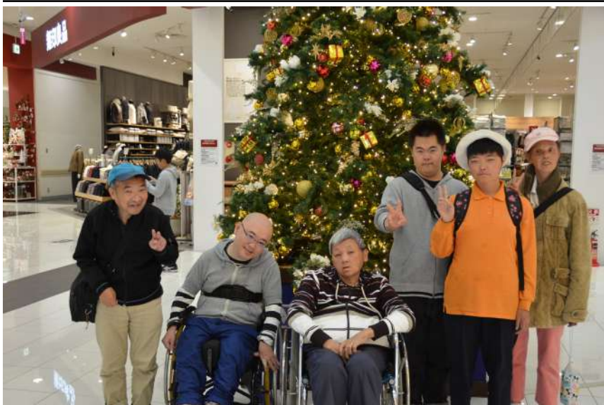
佐野のイオンでハイチーズ