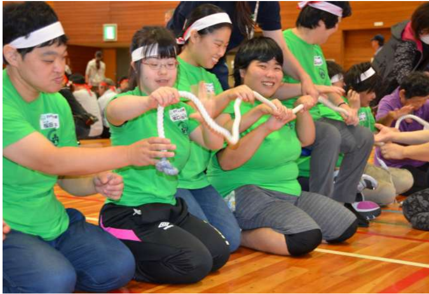
白熱したロープ送り!!

10月11日（木）に栃木市障害者施設協会の主催で、19回目のスポーツ交流会が栃木市長さんも見守ってくたさるなか、栃木市運動公園の体育館で開催されました。市長さんは、手話でも挨拶をしてくださり、耳の不自由な仲間のことも考えてくださいました。 わらしべの仲間たちは、みんなお揃いのわらしべTシャツに着替え、白組として参加しました。開会式後は恒例になった全ての施設の仲間たちと一緒に、ロープ送りの競技から始まりました。今まで