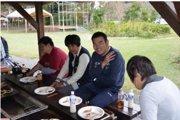
ちょっと食休み中・・・