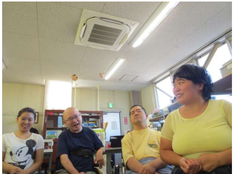
エアコンの下で微笑む仲間たち