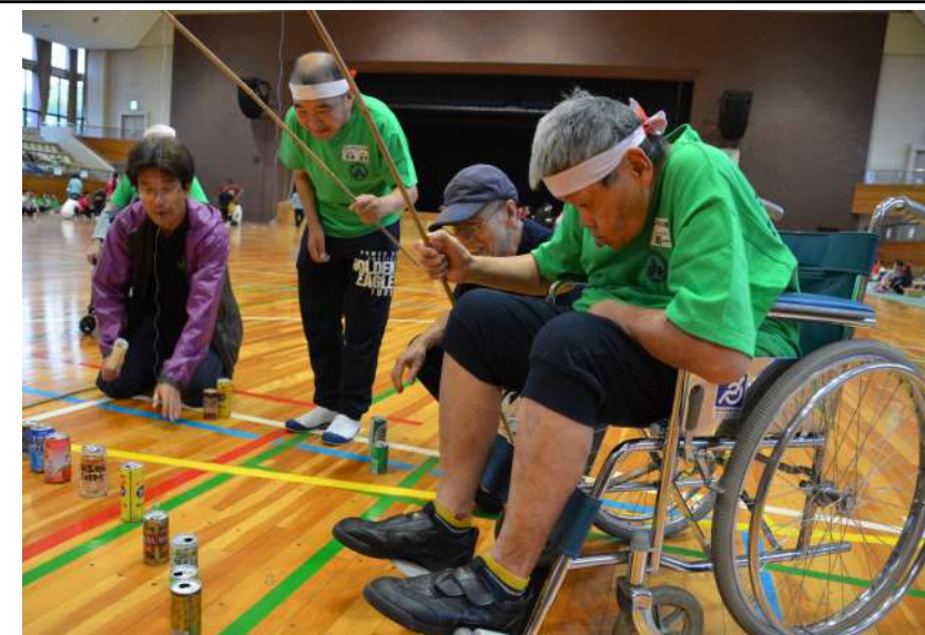
缶つり、意外とむずかしい・・・

した。他の施設ともスポーツ交流を通して絆を深め、体育館を後にする頃には紅組も白組も関係なく楽しい1日となりました。そして、仲間たちはそれぞれの送迎バスに乗って帰路に着きました。 仲間たちに感想を聞くと、玉入れに出場した仲間：「カゴの中に沢山入れられて楽しかった」、必殺！血返しに出場した仲間：「皿をひっくり返す事が出来てうれしかった」、「白組が負けてしまったけれど、楽しかったです」、リレーに出場した仲間：「走れて楽しかった」と話してくれました。（PORI）