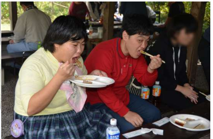
おいしそうに食べてるね!