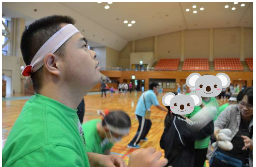
かごに入ったかなあ

のロープ送りは、自分のチームと相手チームが手が届く位の距離で向かい合って競いましたが、今回のロープ送りは、紅組と白組が体育館全体を使いふたつの大きな輪のように広がって行いました。その後は、「玉入れ」、「綱引き」、「必殺！血返し」、「缶釣り競争」など8種目を競い合いました。 閉会式では、紅組の勝利が発表され幕を閉じました。もちろん紅組は喜びましたが、白組も相手の組の勝利を祝福したようでどちらの組もみんな喜び合いま