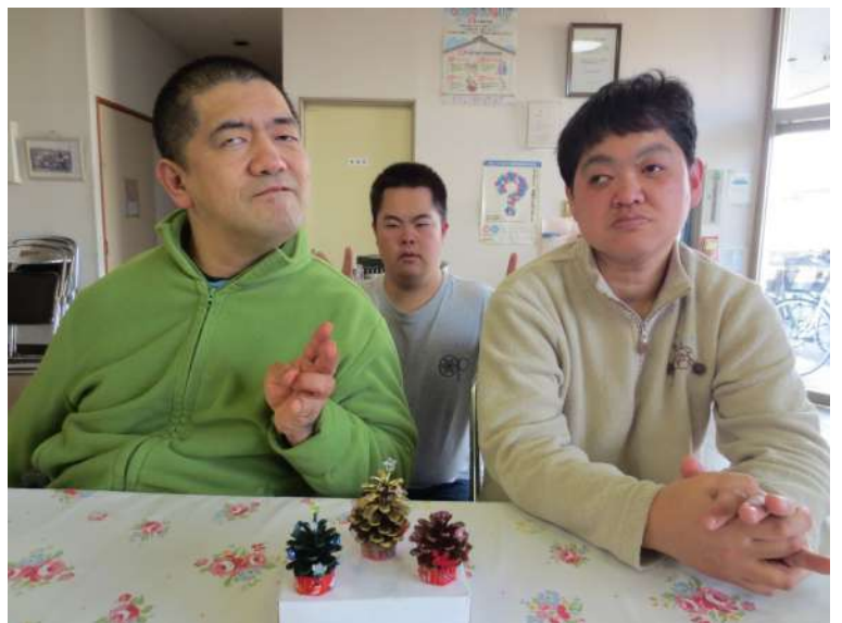
松ぼっくりツリーと仲間たち

になり、そこにキラキラとした赤・青・ピンク・水色などのビーズ、トナカイや星型の飾りなどたくさんのお飾り品をお店のように並べた箱から、選んでいきます。それは、まるで私たちがキラキラした世界へと導いてくれているようで、とても楽しい気持ちにさせてくれました。気がつくとも、みんなの手の中には、それぞれに可愛い可愛いクリスマスツリーが大切そうにありました。 するとひとりの仲間から、もっともっとクリスマスツリーの飾り付けをやりたい！と提案がありました。予定では後日に行うことにしていましたが、時間にゆとりが