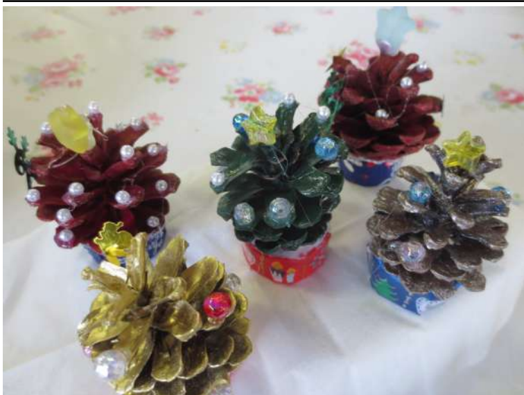
松ぼっくりクリスマスツリー完成！かわいいね♡

あったので、おり紙で作った長いわっかの飾りを部屋中に飾りつけました。一気にクリスマススムードになり、自然と気分はワクワク、楽しい気持ちにウキウキとなった頃には、クリスマス会の準備がすっかり整いました。あとは、当日を楽しみに待つばかり。楽しみです。（P.O.R）