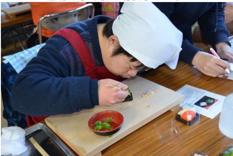
夢中になって取り組んでいます