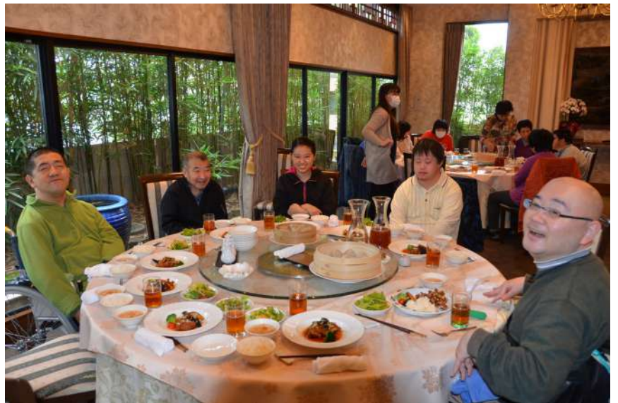
円卓を囲む仲間たち

ね」と金坂施設長の挨拶のあと、円卓テーブルでみんなの顔を見ながらわらしべの家特別ランチメニューを食べました。 楽しみはまだ終わりません。14時からわらしべの家の食堂兼集会場で、歌のお兄さんのミニミニライブが開催されました。ライブが始まる前に「わらしべの家」の紹介を「仲間みんなの力を合わせ部品を組み立てたり、パソコンを使って名刺を作ったり、封筒印刷をしたり、