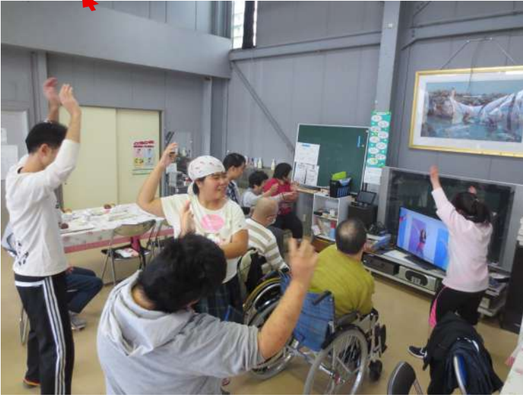
みんなでエクササイズ！！

わらしべの家には、1992年の夏に赤い羽根共同募金の配分金で整備していただいた天井埋込式冷房クーラー2台が第1作業所の作業室に設置され、長く使用できていましたが2017年の夏に落雷のため壊れてしまいました。応急処置でなんとかしのいできましたが、2018年赤い羽根共同募金「災害等準備金」の配分金で、9月21日に最新型の天井埋込式冷暖房エアコンを新たに設置することができました。今までは冷房のみのクーラーでしたが、今からは念願の冷暖房付きエアコンです。 工事中は、別室で作業したり、エクササイズDVDにあわせて踊り、運動して