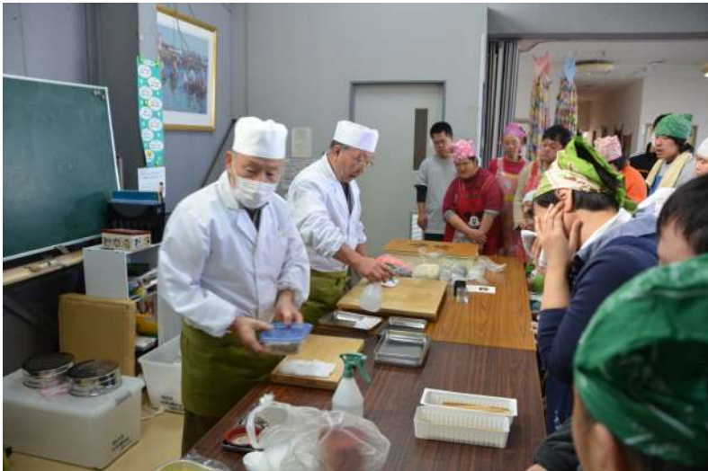
職人さんたちの素晴らしい指さばきにうっとり…