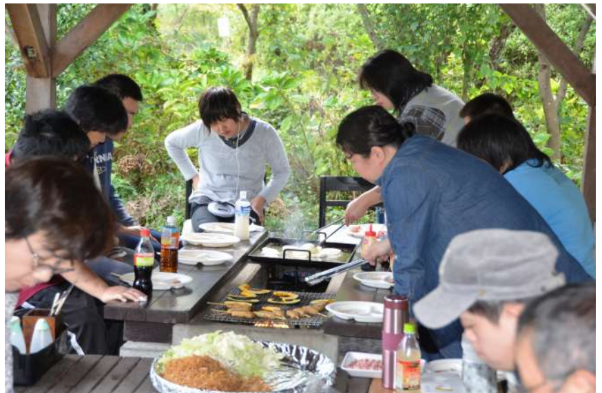
愛情こめて調理中!

流行のJ-POPにあわせて踊ったり、イントロクイズを楽しみ、全問正解する仲間もいたり。まったりとした時間の中で仲間の役員を務めるおちゃめさんが、施設長と兄弟のような会話をしていると、おちゃめさんから「施設長が、かわいいんですけど」と言われ、施設長も「ありがとうねえ」と応対され、会場は笑いに包まれました。それは、みんなが太い信頼で結ばれているのを感じ取ることができた出来事でした。 秋の1日を一緒に過ごした仲間たちは、16時すぎとってもいい笑顔を浮かべ、帰宅していきました。（混む）