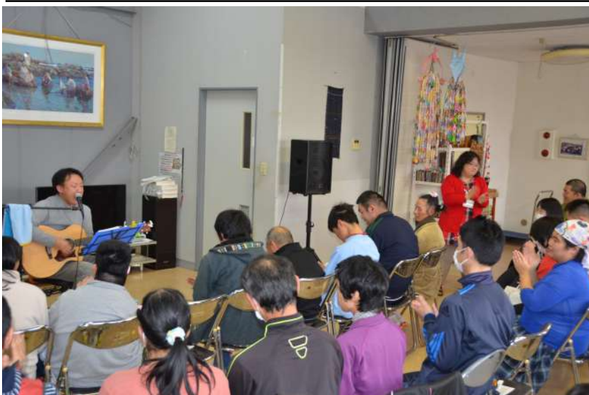
生のライブを鑑賞中!

ホームページを作ったり、さをり織りをしたり、食用廃油再生活動をしていませ」と、みんなでした。 歌のお兄さんは西那須で路上ライブをなさっている方で、ライブでは、お兄さん自身で作られた曲と大物歌手のカバーソングを交互に披露なされ、仲間も一緒に歌ったり、手拍子しながら、ラストソングの「上を向いて歩こう」で大合唱が起りました。生の音楽を聴いたみんなは、すごくいい笑顔で帰宅しました。 (混む)