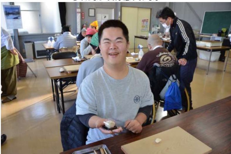
和菓子を作ってにっこり笑顔

12月の土曜開所日は和菓子屋の職人さんたちに訪問していただき、「和菓子作り体験」をおこないました。栃木市内の有名な和菓子屋さんに毎回お願いしています。今回のテーマは季節にぴったりのサンタクロースとクリスマスツリーの和菓子を手作りしました。出張教室が始まると、職人さんがお手本を見せてくれます。目の前で繰り広げられる職人技に感激しているうちに仲間たちが作る番になり、いざ取りかかりますが…職人さんのようにうまくはできません。職員さんにもお願いしても四苦八苦するばかりでまるでできません。そうこうしているうちに職人さんたちが順番にテーブルをまわってください、魔法のように修正しながら“あっ”という間にサンタさんとクリスマスツリーがみんなの目の前にあらわれました！満足そうにそれぞれのサンタさんとクリスマスツリーを眺める仲間たち。みんなの完成を見届けると、職人さんたちも喜びながらお帰りになりました。