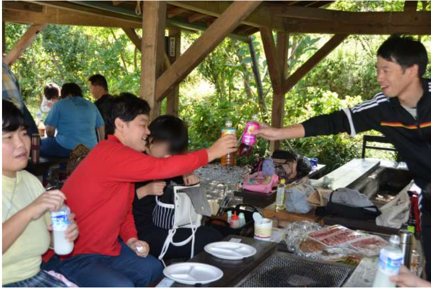
今日もよろしく～ みんなでかんぱ～い!!

10月20日はわらしべの家の余暇活動で、利用者交流バーベキュー会が栃木市内の「サンランド栃木バーベキューガーデン」で11時40分から開かれ、交流を深めました。 「今日は、よろしくお願ひします」と合席になった人たちと挨拶をして各テントでは、激しく燃え上がる炎におっかなびっくりりする姿や、肉汁が染み出たにおいに思わず顔が笑顔になり、上牛カルビ、豚カルビ、鶏つくね串、フランクフルト、エビ、野菜5種類、焼きそば（野菜付）を一生懸命食べている姿が多くみられました。 バーベキューのあとは、テントのそばで今