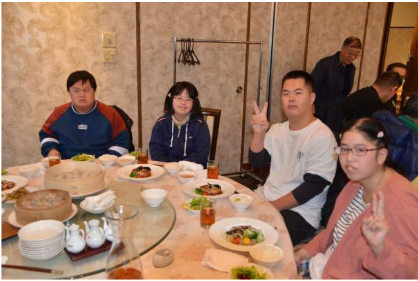
中華料理を前に みんなでイエ～イ!!

2018年11月22日、仲間たちが朝9時までに元気よく出勤し、請け負い事業、自主製品事業、IT事業、リサイクル事業といった4つの持ち場で真剣に生産活動をはじめましたが、この日は10時30分で活動終了。総勢40名が「ランチ会」に参加するため、なじみのある車両4台に乗って、12時までに雅秀殿 栃木本店様に移動しました。 大広間で「今年は日帰り旅行の代わりに、ランチ会&音楽会を支援員さんが企画してくださりました。楽しましよう