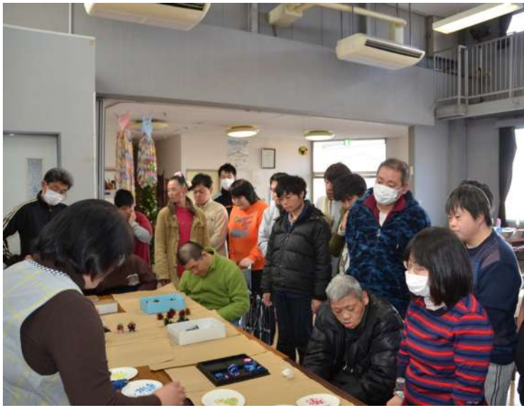
お手本を見学！しっかり見てね～

おいしいお弁当の時間をはさんで、午後はクリスマスツリーを松ぼっくりで作ろう！というお題でまるでカルチャーセンターのような装いで係りの職員さんが先生となり、仲間たちに実演します。最初は、松ぼっくりとクリスマス：つながりがまるでないように思いましたが、実演を見ているうちに可愛い小さなキラキラしたクリスマスツリーが出来上がりました！あらかじめ松ぼっくりには、緑・赤・ゴールド・ブラウンの色付けがされており、そこにマスキングテープなどできれいに飾りつけられた可愛いペットボトルのキャップを台座にして、のりづけします。すると可愛いツリーのように