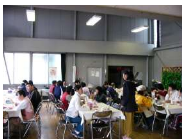
ひなまつり会開催。歌に、塗り絵 に大盛り上がりだった。

三月三日午後二時半からわらしべの家で、利用 者自治会主催による「ひな祭り会」が開催された。 この日で「平成十九年度わらしべの家仲間の会年 間計画」として、成立した行事はすべて終了した。 休憩時間前に仲間たちは食堂に集まり、一人一 人に雛あられやジュースが配られ、皆で楽しい 「おしゃべり」をしながら時間まで、ひな祭りを イメージした塗り絵を楽しんだ。プログラムで は、挨拶のあと、カラオケを利用し、「うれしい ひなまつり」をみんなで合唱する予定だったが、 曲目リストに見当たらないというハプニングが 起きた。すぐに全員のアカペラで「あかりをつけ ましよ ぼんぼりに お花をあげましよ 桃の花」と 歌い、会を盛り上げた。会がすすむと、色鉛筆と塗り絵 が配られた。参加者たちが塗り絵を楽しんだのは、数年 ぶりであった。真剣な表情と懐かしそうな表情を交互 に浮かべながら、黄色や桃色などの色を閉会するまで 思い思いに紙に塗り、終わらなかつた絵は仕事の合間 で塗り上げるという楽しい宿 題となった。終了後、参加者た ちは、「『うれしいひなまつり』 とか、みんなで歌えたり、塗り 絵を楽しめたので、来年も楽 しみ」と、話していた。また、 司会を努めた仲間も充実した 表情を浮かべていた。(混む)