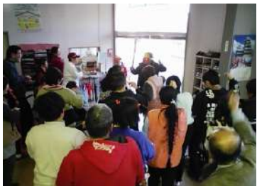
わらしべの家で、豆まき。鬼は、 痛がりながら逃げていく。

その後、各テーブルに戻り豆を今年一年健康で いられるようにと皆で食べた。この一年も仲間が 幸せに過ごせますように……。(P.001)