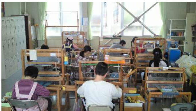
仲間たちが織った反物は、世界にひとつだけしかありません。