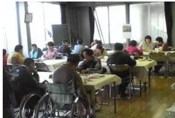
みんなの幸せを願って開かれた、ひな祭り会