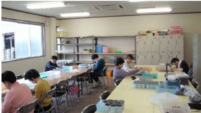
部品組み立てに取り組み請負作業の仲間たち。