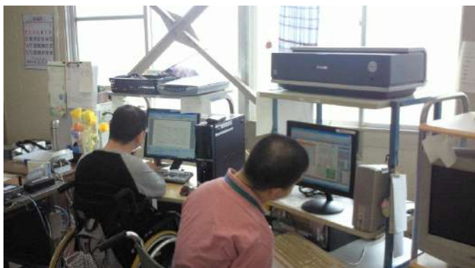
名刺作成・ホームページ作成のことから、パソ工房にお任せください。