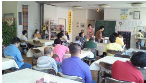
仲間の会会議の風景

3月19日に開かれた仲間の会会議では、平成22年度わらしべの家仲間の会年間計画を決めることができました。仲間の会の後、会長は年間計画をつくるにあたって、「ハイキングやゲームなどいろいろな意見があって、たくさん迷ったけど、決めるのは楽しかった」と話していました。さらに会長になって成長したこととして、「人前に出るの、恥ずかしいけど、みんなの顔はちゃんと見られるようになった。今までは、人前に出ることもなかったし、ひっこみじあんだっけ、ど、ちょっとびり成長できたと思う」と、評価して「みんなが話し合いに参加してもらえるように他の役員たちとも意見を出し合って行きたい」と、任期を全力で取り組む考えを示し、今年9月に行われる仲間の会役員選挙立候補には、「立候補までにはまだ半年もあるので、考え中です」と話してくれました。