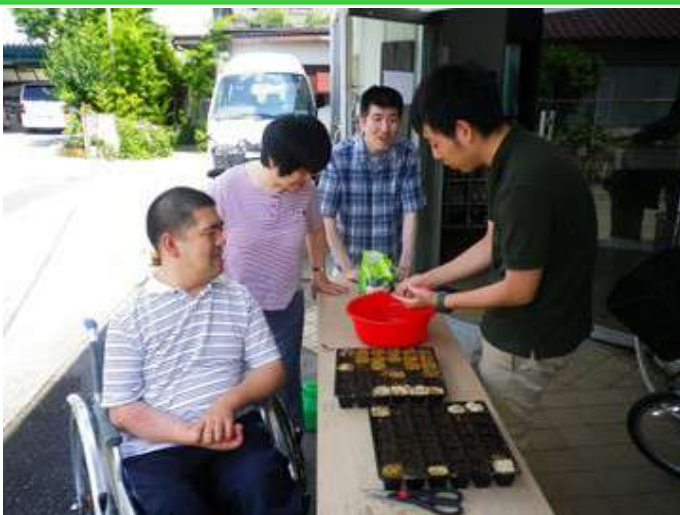
ポットに種をまき、肥料の布団をかぶせています。

今年度からわらしべの家では、天気のいい日の昼休みに第2作業所の一角に花壇を仲間と施設長で作っています。 梅雨の晴れ間が覗き込んだ6月29日午後、玄関先に集まった第1作業所で働く仲間たちは順番でポットに種をまき、肥料の布団をかぶせました。 芽が出てくる日が非常にたのしみです!! (〇)