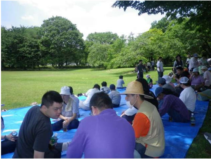
栃障協清掃ボランティア風景。木陰で、のんびり。

晴れて過ごしやすいい陽気となった6月7日に、栃障協主催の恒例行事である清掃ボランティア（ゴミ拾い）を行いました。市内にあるいくつかの施設が集まりました。清掃ボランティアに行く前日に仲間たちに、行く前の感想を聞いてみました。ある仲間は、「公園をきれいにするのが楽しみです。」「明日のお天気が心配です。」「他の施設の仲間とレクリエーションをすることが楽しみです。」「明日が楽しみです。」と話していました。