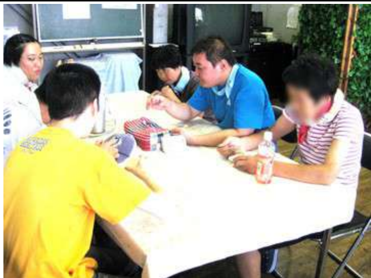
冷たくて、あまいバニラアイスさんに身体を冷やしてもらっています。