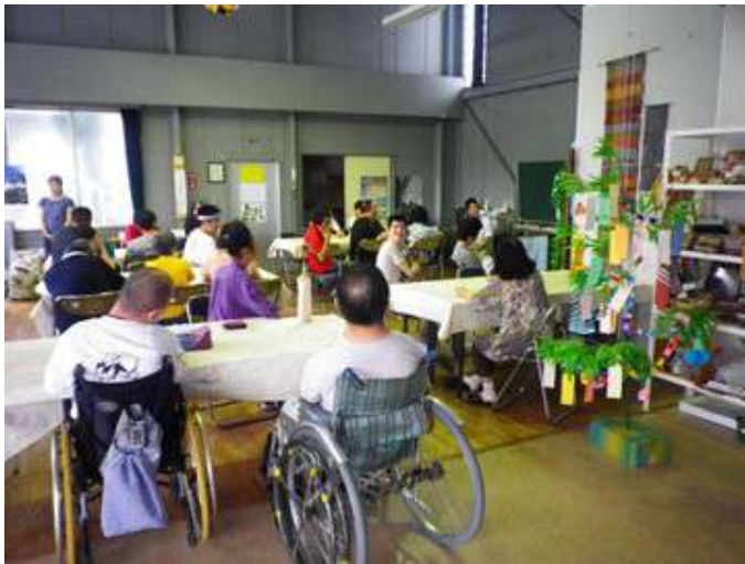
七夕の会。みんなの願いが通じますように。

七夕の日は、1年に1度だけ「おりひめ（織姫）」と「ひこぼし（牽牛）」が天の川の上でデートをする日といわれ、この日にちなんで、願い事を書いた短冊を笹の葉につるし、おりひめ星に技芸の上達を願うとされています。 わらしべの家でも、7月6日の午後から仲間の会主催で「七夕の会」が開かれました。 今年の七夕の会では、予定にはありませんでしたが、施設長が司会の人をサポートし、「たなばたさま」を大合唱。合唱団並みの迫力が、響き渡りました。 笹につるされた色とりどりの短冊には、「巨人が優勝してほしい」、「新しいアニメがテレビで、見たい」、「嵐に