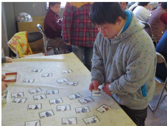
魚の絵合わせ、正解はどれかなあ。