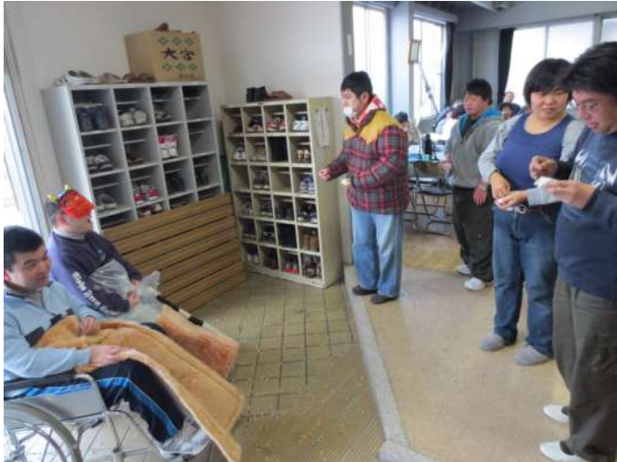
節分豆まき わあ、鬼がふたりいる～

2月3日は節分でしたね。わらしべの家も1日(金)14時45分から仲間の会主催の恒例行事である豆まきを食堂にて行いました。 今年の年男は、私の母校を卒業した36才の2人が、鬼の役になりました。わらしべの家の玄関に鬼が現れると、仲間たちは、テーブルごとに用意された豆を持って「鬼は外、福は内」と言いながら豆を投げました。鬼は、「痛いよ、痛いよ」、と言って山の奥へ逃げていきました。ここにはもう現れないでしょう。それと同時に、体にある悪いむしも追い出しました。鬼の役になった仲間は、「みんなに福が来るように祈っていた」と話していました。