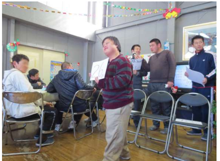
施設長の年齢を僕が当てました