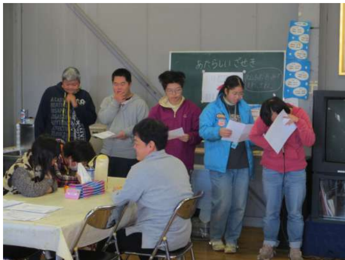
新年の抱負を発表しています。目標があるって、いいですね。

除夜の鐘の響きとともに2013年がやってきて、あっという間に1月4日仕事始めの日になりました。仲間たちは元気よく出勤して、お互いの顔を見合わせると「おめでとう、今年もお願いします」という新年の挨拶をしていました。 13時30分から、5回目を迎えた仲間の会主催による「みかんを食べながら新年の抱負を語りあう会」が開かれました。この日は、1人ずつ「遅刻、早退を減らす。仕事をもっといっぱい出来るようにする」、「パソコンでできる仕事は、一生懸命にやりたいです。わらしべに1日も休まないで、全部出席したいです」、「年男として迎