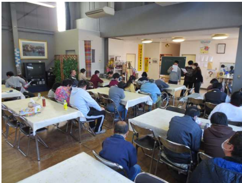
仲間の会会議の風景