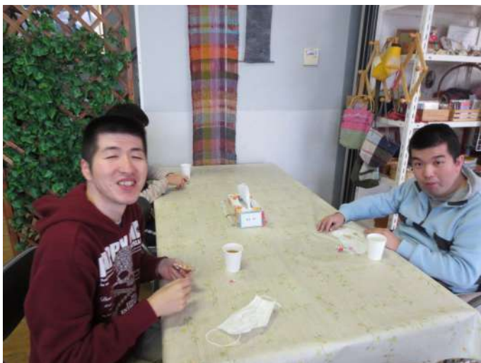
豆を食べて笑顔の仲間たち

そして、席に戻った仲間たちは、この一年間無事に過ごせるようにと豆を食べました。お茶を飲み雑談しながらゆったりとした時間を過ごせました。ある仲間は、「豆を投げられて楽しかった」、「順番を決めて(テーブルごとに)豆を投げられてよかった」と、話していました。 これで、豆まきの行事は無事に終了しました。節分が終わった後は、暦の上では春ですネ。寒さにもお別れが近いようです。三寒四温で春を待ちましよう。(PORI)