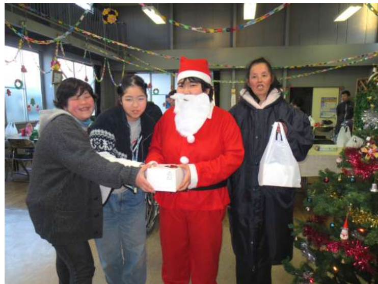
サンタさんと、ハイポーズ！

した。最後は、施設長は何歳でしょうか？の問題に、ある仲間は40歳のパネルを手にして答えましたが、施設長が「40歳ではありません」と答え、はずれました。次の仲間がチャレンジして見事当てました。会場を盛り上げた所で、次は、ビンゴゲームをやりました。今回は、10月に購入した新しい通信カラオケの中にビンゴゲームのルーレットの機能があります。ルーレット形式が本格的なので、ぐるぐる回って止まる頃にはゆっくりになると、仲間たちは、「この数字が出るように」、「あの数字、出る出る」と言っていて、願いどおりの数字が出たら「あったあった」と、楽しく大騒ぎしました。仲間たちは、一列揃う一歩手前になると