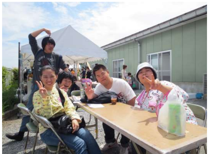
ゆーあい工房まつりの昼休み

色、きれいだった」と、話していました。13時すぎから会場では「のど自慢」が始まり、市内の施設から出場を希望した仲間たちは、たくさんのお客さんを前に、思い思いに歌を披露し、まつりに花を添えました。「なごり雪」を歌った仲間は、「緊張しましたがちゃんと歌えて、よかったです」と、ほっとした様子でした。14時30分、ゆーあい工房まつりは、これまでの歳月でできた地域との絆を再確認し、閉会しました。まつりが長く続いていることについて、わらしべの家・仲間の会長は、「16年続いている？すごいですねえ！毎年、地域の方に会えるのを楽しみにしています」と、話していました。（混む）