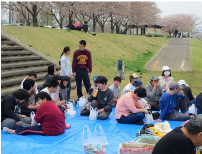
青空の下で、自己紹介する仲間