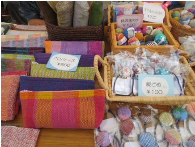
さをり織り製品の数々

5月19日に第16回ゆーあい工房まつりが開催され、わらしべの家の希望者全員で参加しました。まつりの会場には多くの人たちが訪れ、迫力のある和太鼓演奏に耳を傾けたり、スタンプリーを楽しんだり、話に花を咲かせている人たちもいました。そんな会場でわらしべの家は手際よく開店準備をして、午前10時30分の開店時間から外に設けられたテントで、「いらっしゃいませー」「ありがとうございます」「さりを織りなどの自主製品販売をしていました。夏のような暑さもお客様としてやってきましたが、会場全体に流れたハンドベルの演奏で心地よい涼しさに、入れ替わったようでした。演奏を近くで聴いていた仲間は、興奮気味に「ハンドベルの音