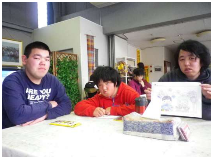
仕上がった塗り絵を見せてくれている仲間たち

持ってくださ い。乾杯と いう音頭を皮 切りにみんな で仕事のこ と、日常生活 での出来事を 話題に楽し 「おしゃべ り」をしながら ら時間をなが りんだり食べ たり仲間でし 顔は笑顔でし た。(混む)