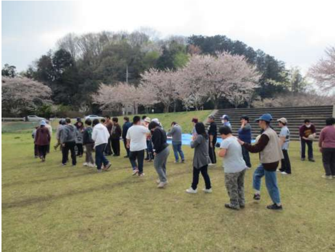
レクリエーションを楽しんでいる仲間たち