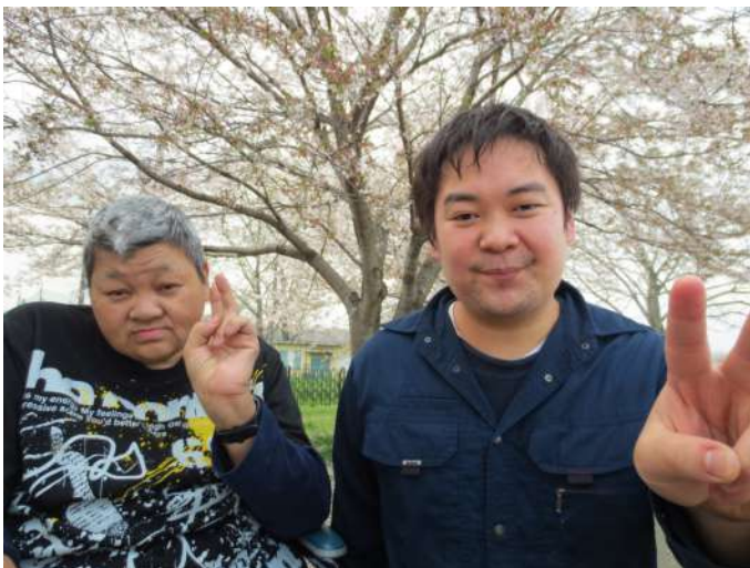
仲良くピースするふたり

わらしべの家で新年度の最初の行事。それは毎年恒例の「花見会」です。4月5日の午後、栃木市内にある「永野川河川敷緑地公園」にて行いました。天気は晴天でしたが、今年は、あっといいう間に桜の花が咲いてしまい、咲いたのかなあと思ったら、今度は、寒さが戻ったりして、見る頃には桜の花も散り始めていましたが、花見に行つて来ました。