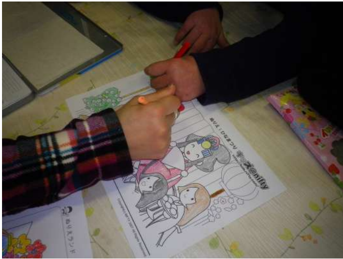
色鉛筆で塗り絵を楽しんでいます

3月3日は「桃の節句」。 わらしべの家でも3月1日 (金)、仲間の会主催による 「ひな祭り会」が開催されました。ひ な祭りは、午後2時30分から塗り絵 で始まり、仲間たちは、ひな壇飾りに そっくりに塗り上げたり、「髪の毛、 せっかくだから茶色に染めようか」 「そうしよう」という会話の中からみ んなで相談し色使いを変えたりと、 テーブルごとに個性あふれるひな壇が できました。 そして、塗り絵が終わった午後3時 15分から、通信カラオケにあわせ「う れしいひなまつり」を歌い心が、盛り 上がりほかばかに暖まり「紙コップを