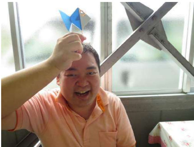
きんぎょを手に取り、ハイ!ポーズ!

を食べ、「冷えて、鼻の奥が痛くならない?」「うん、なるよね」といった少しの会話しか聞こえませんが、その光景に「年々進化して支持されていることにありがとう」と思いながら食べていたのは、「アイスを食べる会」を発案した当時の役員の1人でした。 食べる会に参加した39人は、引き続き開かれた6月分の皆勤賞表彰式をみんな大満足の表情で見守り、6月1カ月間休まず仕事をした19人の人に拍手を送っていました。その中の3人は、4月1日から6月30日まで61日休まず仕事をしているように、さらに大きな拍手を送られていました。「アイスを食べる会」が終われば、夏休みも近いです。そして、実りの秋へ季節はめぐっていきますね。