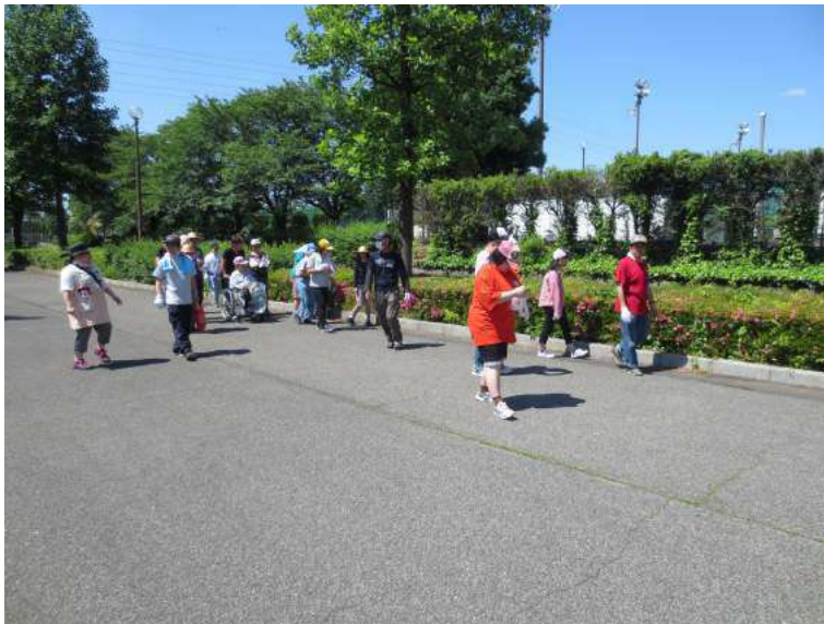
散歩じゃないよ！ごみ拾ってますう～！

6月2日は、まさに朝から初夏を感じさせるさわやかな日、栃木市総合運動公園において、栃障協主催の恒例行事である清掃ボランティア活動（ゴミ拾い）が行われました。市内にあるいくつかの施設が集まりました。栃木市内の各施設が集まったのはゆーあい工房のお祭り以来です。 公園に着いたら、駐車場で職員から仲間たちに1人ずつ軍手や、燃えるゴミ・ペットボトル・空き缶を入れる種類別の袋が配られました。園内を施設ごとに歩きながらゴミ拾いを実施しました。今回も、施設ごとに回って最終目的地の「芝生広場」へ進む道順です。初夏の日差し