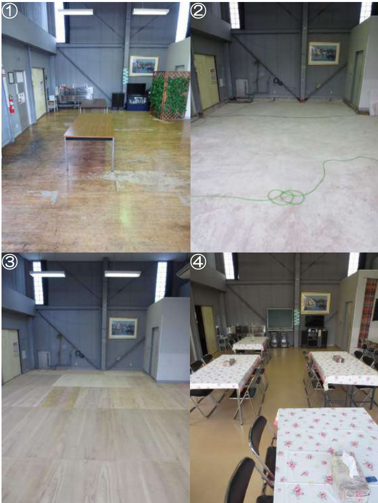
わらしべの家ホール（食堂兼集会場）の床リニューアル工事のながれ

6月3日正午、みんないつものとおりわらしべの家第1作業所にある食堂兼集会場に集まり、この日出されたたまごサンド、黒糖ロール、コンソメ煮、大根サラダなどをおいしそうにほおばって、夕方にはラジオ体操で身体をほぐし、施設長から「来週6月6日から、床を張り替える工事をします。その間、各作業所でお昼を食べてもらい、帰りの会もお休みです」と話があり、仲間たちは16時にさびしそうに1983年から見守ってこられた床に別れを告げながら、帰宅していきましました。 週が明け、6月6日朝から床を張り替える工事が行われ、古い床を取り除いた工程のあとに、きれいでしっかりとした基礎が顔をのぞかせ、普段見られない部分にみんなは歴史