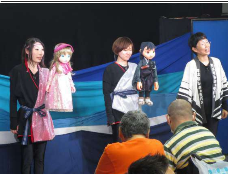
劇団つばさの皆さんが最後のあいさつをしている様子