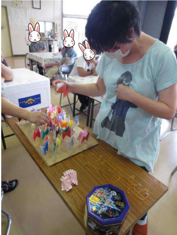
真剣なまなざしで、きんぎょ釣りに挑戦!!

8月5日午後、2009年夏から毎年恒例となった「アイスを食べる会」が開かれました。今年も、「ひとつのアイスをみんなで食べるのもいいけど、さまざまな種類のアイスを食べるのも、いいよね」という仲間の会担当支援員さんの発案で、数種類ものアイスが準備されました。あらかじめ用意されていたいろんな色の折り紙で作られた金魚を釣る遊びを楽しみました。釣った金魚の色によって運命を左右されることになろうとは、誰が予想したでしょう。仲間、支援員さんあわせて39匹の金魚が手元に届いたところで、仲間の会担当支援員さんから呼ばれ、「赤い金魚だから、いちごのアイスね」、「黄色い金魚は、レモン味!」とクローボックスからいろいろな種類のアイスが配られました。種類の豊富さは駄菓子屋を思わせるほどでした。即席の駄菓子屋からアイスをもらい、釣った金魚の色に納得していたり、少し納得していなかったりさまざまなお表情がありました。テーブルで食べている至福のひとときは、ゆっくりに過ぎていき、みんな童心に戻りアイス