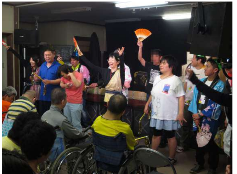
オープニングでの1コマ。踊っている仲間たち!!

がしていましたけど、終わりました？」という問いかけをいただき、元気に「はい、終わりました」という返答で、歌って、踊って、元気よく、公演がはじまりました。 物語のあらすじはというと、とび丸は、殿からあずかった大事な巻物と貢ぎ物を届けるため、サムライ号に乗り、フシザリア国をめざし出航しました。途中で、なぜかわらしべの家に立ち寄り、忍術の稽古をしました。仲間や職員が敵方の忍者に紙で作られた手裏剣を投げ、「免許皆伝」と認められていました。わらしべの家で稽古をしたとび丸の行く手