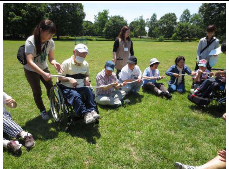
ロープ送り・・・笑顔も満開！

ある仲間は、「タバコや空き缶が落ちていました」、レクリエーションでは、「ロープ送りが