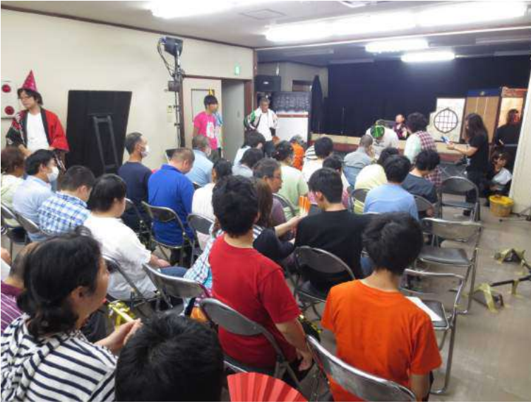
サムライ忍者とび丸、わらしべの家に参上の巻

6月24日、わらしべの家第2作業所で日産労連NPOセンター「ゆうらいふ21」主催チャリティーきゃらばん（巡回公演）が開催されました。この日は、作業所周辺にのぼり旗がたち、2階には大きな舞台装置が組まれて、どこかの劇場にきたような錯覚が32名の仲間たちを包んでいました。 おはなしキャラバン「つばさ」による公演は、わらしべの家に通う仲間にとつては動物と人間の心の交流を描いた「象つかいソムポット」に続いて2作目の公演となり、団長さんからも「数年ぶりですね。4月、下見に訪れた際にはいちごのへた取りをしていて、いちごのいい香り