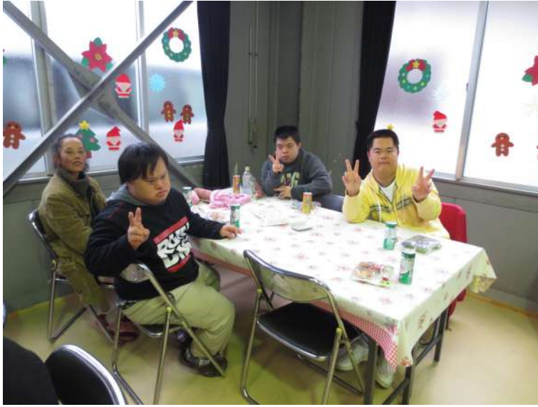
クリスマス会で、イエーイ！

みんなが集まる12月22日にクリスマス会が開かれました。「仕事がない」と毎週月曜日～金曜日の週5日、朝9時～午後4時まで勤勉に働いている仲間たち。その労をねぎらおうとサンタさんがやってきて、司会進行をしながら輪投げの提案。仲間たちはクリスマスプレゼントをもらう順番をかけて1人ずつ前に出て輪投げをしようとした。「えい！」「やあ！」「1から9の的にうまく入ったなと思ったら、力みすぎてなのから思いっきり外れたり、まったく入らなかったり・・・。サンタさんからもらったプレゼントに納得していたり、少し納得していませんでした。