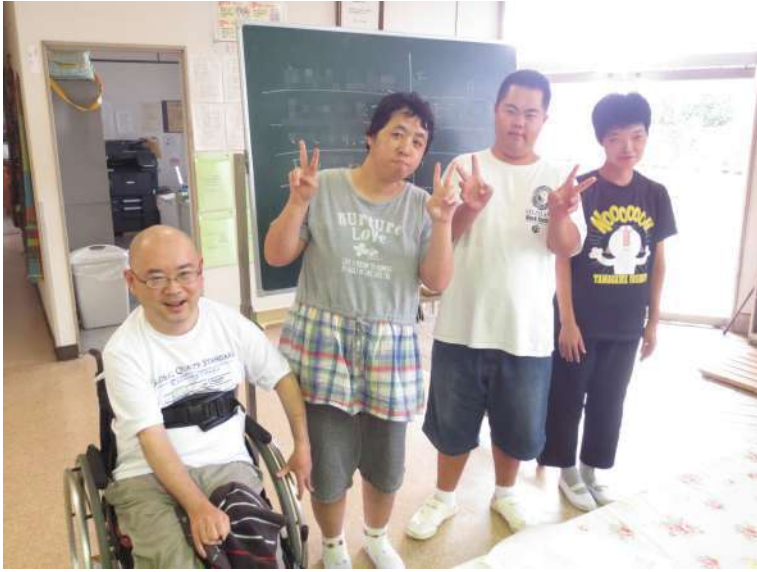
仲間の会新役員顔ぶれ

わらしべの家での仕事や、生活がよりよくなるようにと1997年に出来た「わらしべの家仲間の会」。仲間たちから意見をよく聞いて仕事や生活に生かすための役員を選ぶ選挙が、9月9日午後開催されました。選挙は2年に1回行われています。立候補した人は演説会で、仲間の会をどうしていきたいか、それぞれの思いが込められた言葉で演説をしてこの日、出勤していた仲間全員で投票をしました。