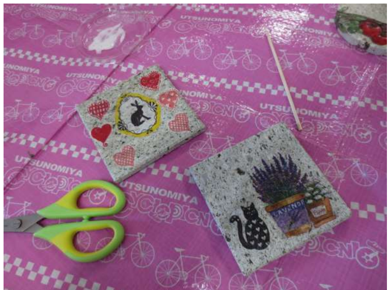
完成したコースター

代表的な星座を勉強し上映後みんな少しだけ星座が好きになりました。2016年日帰り旅行の午前中は、宇都宮市大谷町にある「大谷石体験館」を訪れ、おしゃれコースター体験コースを体験して自然のありがたさを感じるといふものでした。体験館で午前10時30分から行われたコースター体験コースでは、インストラクターの人に教えてもらいながら、コルクが貼られた大谷石に好きな模様を思い思いに貼っていき、世界に1つしかないコースターを作って、笑顔を咲かせていました。できあがったコースターはお土産としていただきました。