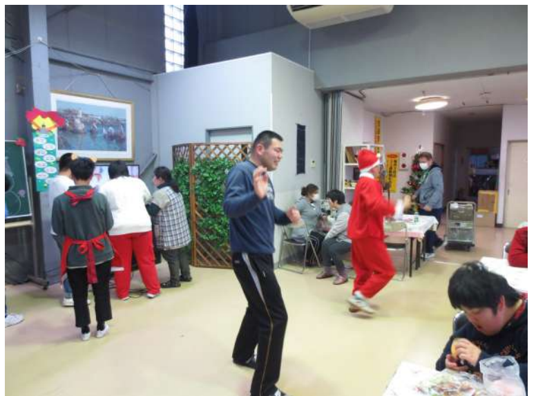
会の後半、AKB48の「恋するフォーチュンクッキー」を歌い踊る仲間たち

さまざまな表情がありました。次に、箱の中にあるものを触りながら、周りの人のヒントを参考にそれがなにかあてるゲーム「これ、なあに？」を楽しみました。当たっている仲間は、恥ずかしさど何が入っているのかとドキドキ。自分が感じた答えを言い、あたっていても、はずれていてもみんな驚いていました。