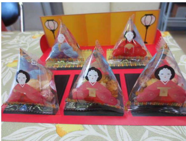
ひな壇風のあられ

り絵を楽しみ、みんなちがって、みんな個性あふれるひな壇レクリエーションができました。 そのあと、通信カラオケにあわせ「うれしいひなまつり」を歌い「紙コップを持ってください。乾杯」という音頭を皮切りにみんなで仕事のこと、日常生活での出来事を話題に楽しい「おしゃべり」をしながら飲んだり食べたり・・・みんなでわいわい楽しい時間を過ごし桃の節句を今年も祝える幸せをかみ締めているかのようでした。 平成28年度の年間計画を無事終わらせた達成感からか、仲間の役員と担当支援員さんの顔は笑顔でした。（混む）