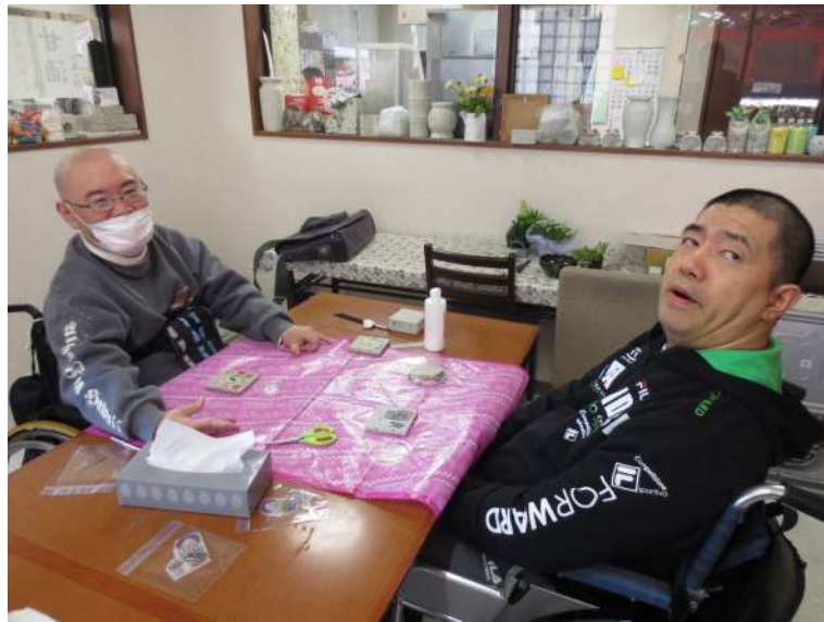
コースター作りを体験

11月としては31年ぶりとなる初雪が11月24日（木）に降り、雪化粧された栃木県内。翌日の11月25日に13回目となるわらしべの家恒例の日帰り旅行が行われました。この日は、路面は乾いていたものの道端に雪があるという11月とは思えない景色を見ながら、宇都宮方面へワンボックスカーチエアキャブ仕様車2台と栃木市社会福祉協議会のマイクロバスで行ってきました。 2015年日帰り旅行の午前中は、宇都宮市西川田にある「栃木県子ども総合科学館」を訪れ、プラネタリウムでジャックと豆の木をモチーフにした番組を45分間見て、物語を通して、秋と冬の