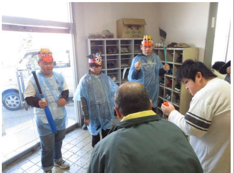
仲間たちが、「鬼は外！福は内！」と鬼たちに豆を投げている様子

わらしべの家の玄関に入ってきました。仲間たちは、テーブルごとに8つの班に分かれ、順番に用意された豆を持って「鬼は外、福は内」と言いながら豆を投げ、鬼退治をしました。鬼は、「痛い、痛いよ」と言って山の奥へ逃げていきました。それと同時に、1年のうちにいつのまにか体に入り込んだ弱むしや怠けむし、いじわるむしなどの悪いむしたちも追い出せたようでした。 鬼を担当した仲間は、「鬼の役、楽しかった。みんなに『ガオー』と言ったら、驚いていて、楽しかった」と話していました。 全員が投げ終わった後、席に戻って仲