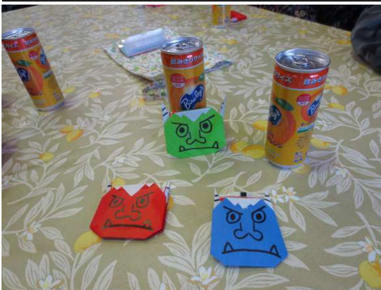
豆まきの後のおやつは、鬼の顔の折り紙に入っていた豆とジュースでした

間たちは、この1年間無事に、健康で過ごせるようにと豆をいただきました。お茶を飲み作業のこと仲間同士のこと、家でのことなどいろんなお話をしながらゆったりとした時間を過ごしました。ある仲間は、「豆を楽しく投げられてよかった」、「とても楽しかった」、「（この前）席替えをしたので、今回はテーブルの仲間が変わっての豆まきをしました。3人の鬼さんに豆を当てられて良かったです」と、話していました。本日の豆まきの行事は無事に終了しました。節分が終わった後は、暦の上では春です。寒さにもお別れが近いようです。三寒四温で春を待ちましょう。（PORI）