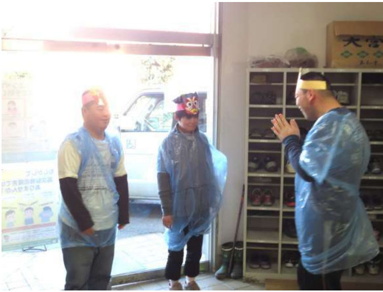
節分・豆まきの様子

今日は2月3日の節分です。わらしべの家も15時から仲間の会主催の恒例行事である「豆まき」が食堂にて開催されました。 仲間の会の会議で、鬼の役になりたい人を聞いたら、3人の希望者があり、鬼になってくれました。ところが当日の朝、鬼になってくれる3人のうち2人が欠席となり、急遽、仲間の会の会長と副会長が鬼の役を引き受けてくれました。節分の鬼たちは、みんなの体のなかにある悪いむしを取ってくれます。14時45分に作業が終わり仲間たちが休み時間に食堂へ集まり、節分の準備をしていたら、どこからともなく鬼がスキップしながら