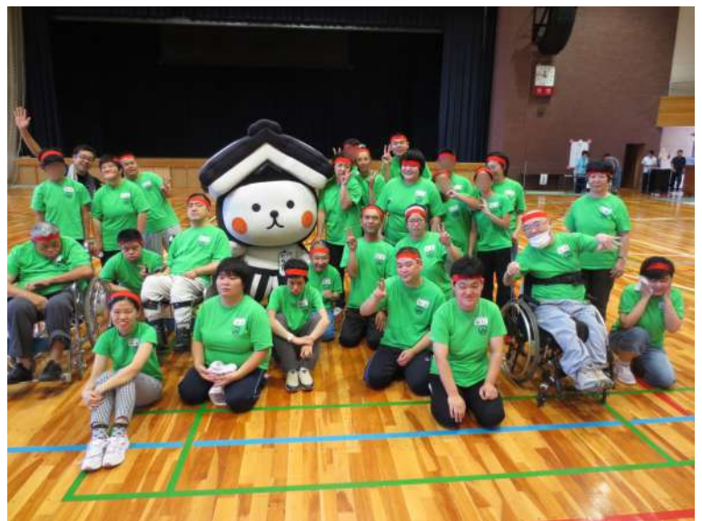
とち介と一緒に全員集合！

たい種目を第1希望、第2希望と選んで、それ以外の競技に出場をしました。2回戦までやりました。 技では、各施設の施設長さんたちが協力して、いろいろな衣装を着せ、競争力を変身しました。アニメキャラクターや、戦席にいます。仲間たち、行列になつて、体育館内を1周パレードのようになって、応援席にいくれました。わらわら仲間のなから、「ミニーちゃん」になったよ」といっ う声があがり、綱引きの競技中に、栃木市のマスコットキャラクター「とち介」が応援に駆けつけ、タレントも出てきました。