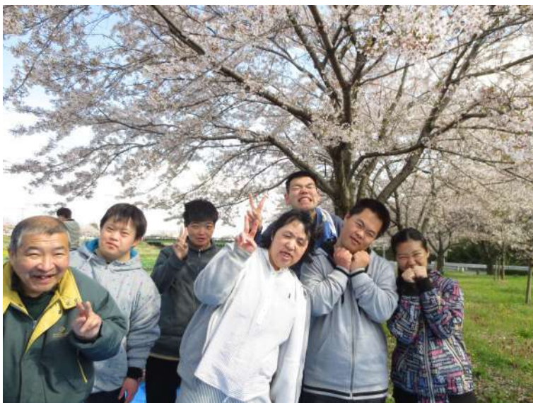
桜の木の下で、笑顔も満開!