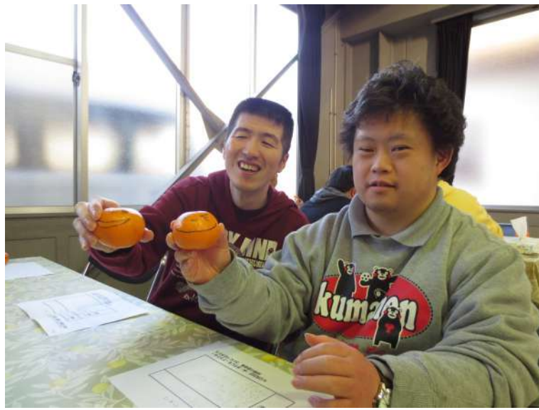
新年の抱負を語る会でくつろぐ仲間たち

1月に開く仲間の会主催による「みかんを食べながら新年の抱負を語りあう会」のために、仲間の会長が12月のある日、新年の抱負を書く紙を持ってきました。2017年にかける自分の思いを書いて、みんなの前で発表し、思いに近づき努力をしなくてはなりませんから、その紙を「うれしい！」という表情で受け取る人もいれば、「またあ」という表情の人もいました。 それでも、提出期限の2016年12月28日になり、いつもどおり仕事をし、新年の抱負を提出し、夕方仕事納めとなり、午後4時過ぎ、「さよなら、お疲れ様でした。また来年」といいながら、