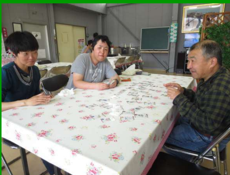
かるたをしています。誰が一番取れるかな？