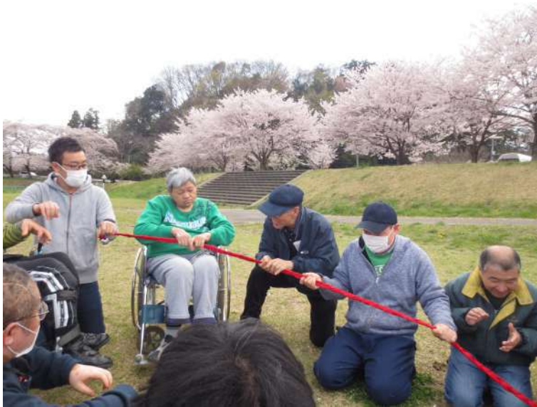
ロープ送りを楽しむ仲間たち