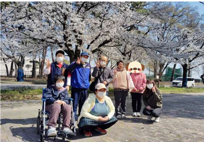
永野川緑地公園にて

【今回の記事は、パソ工房所属の仲間・ペンネーム：混むがお伝えします】ニユースで伝えられる令和7年の桜開花予想は3月28日でした。しかし、4月1日から3日まで窓の外を見ると、春から冬に逆戻りしたような天候でした。その天候が花を咲かせ続けてくれたのでしょうか。4月4日夜のニユースで「栃木市の太平山では満開です」と伝えられていました。その翌日の4月5日、わらしべの家はお花見&ドライブとしてグループごとに分散しお昼の買い出しも兼ねて出かけました。令和7年も見られた桜