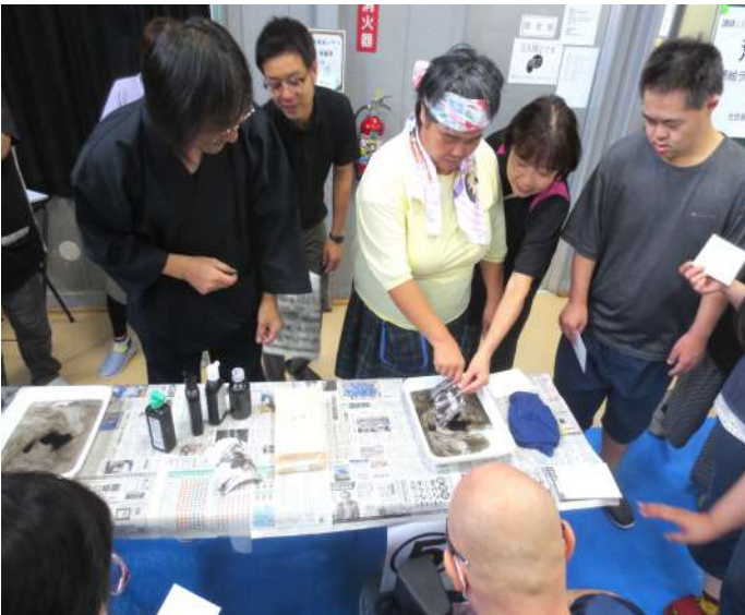
みんなではがきに墨流し体験