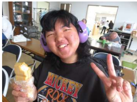
モナカおいしいです