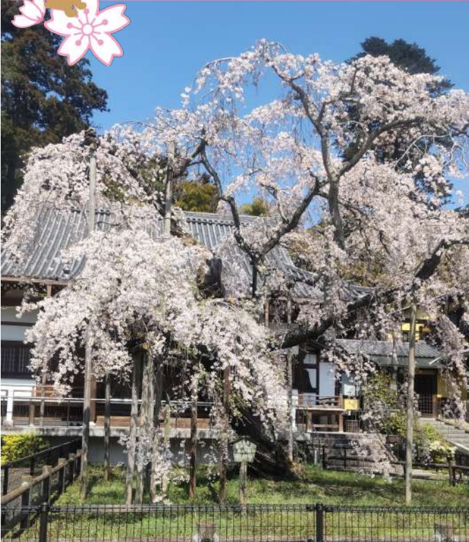
太山寺のしだれ桜