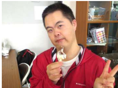
冷たくておいし～い！