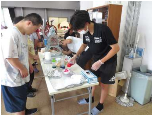
氷にシロップをかけてくれました