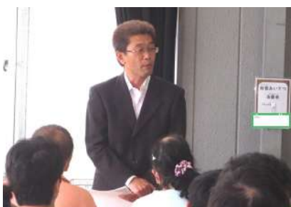
就任された橋本施設長