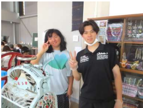
記念に「はい、チーズ」

今年度の介護等体験の大学生もこれまでと同様に自分を広げられて帰られました。仲間たちにとっても好青年のお兄さんと楽しい