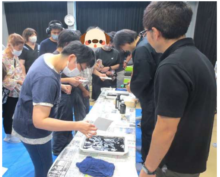
「私のはがき、できたかな？」