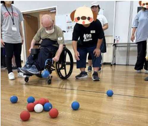
目標球に球を寄せて