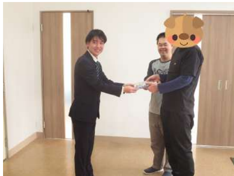
わらしべの里から感謝の 気持ちをお贈りします