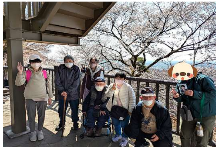
太平山・見晴台にて