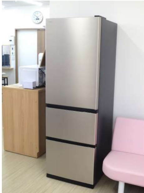
寄贈された日立の冷蔵庫