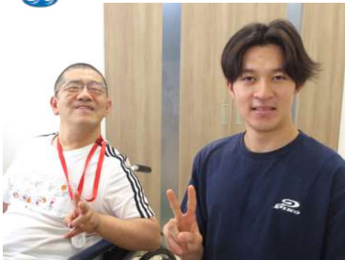
仲間とピースサインをする大学生さん