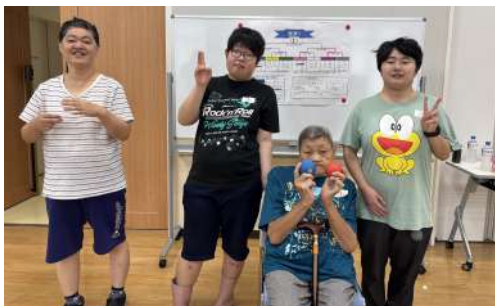
真夏の優勝チーム

目標球がすべての鍵となったリーグ戦 準備体操のあとは、リーダーとなる支援員さんも入って8チームのリーグ戦です。この日も、目標球の位置がすべて鍵を握っていました。目標球が近くて安堵しても自球が届かなくてこの日は惜しくも敗退したチームもあれば、遠い目標にゆったりとした打球フォームから目標球にピタピタと寄せて練習の成果が出たチームなどそれぞれでした。 ノーサイドになったあとに 戦い終えて、インストラクターの先生から「ポッチャのイベント開催をするときはお伝えしますので、遊びに来て下さい」と挨拶され、仲間たちは「はい」と元気な声を響かせていました。